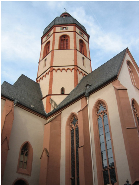
Die Kirche St. Stephan in Mainz

DE90 6025 0010 1001 4801 78 Name, Tagesreise Mainz